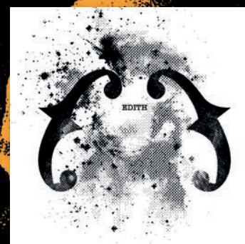
album - 2012