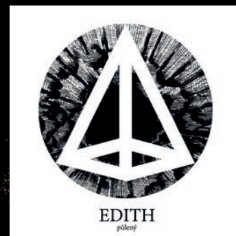
půlený - 2019