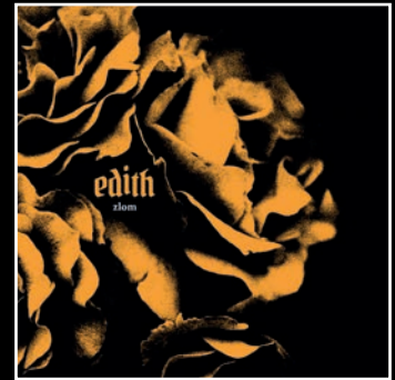
zlom - 2026