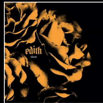
zlom - 2026