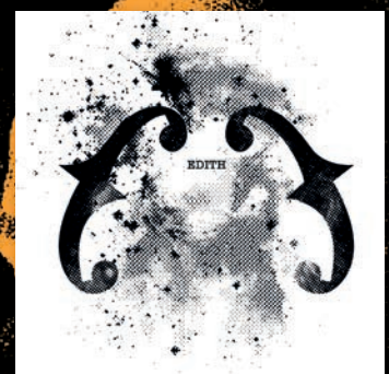
album - 2012