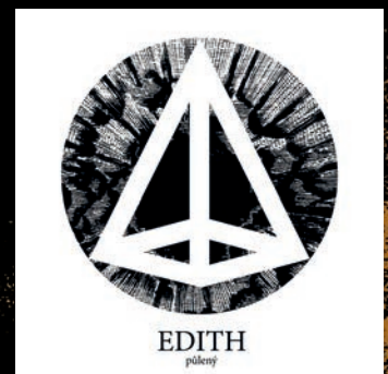
půlený - 2019